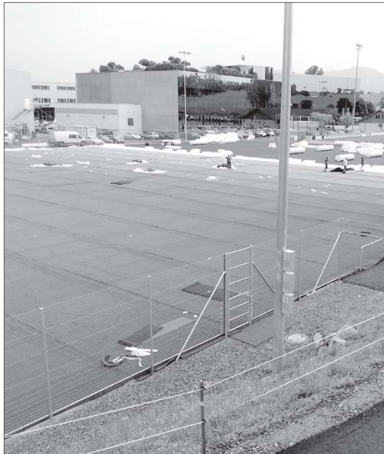
Die Kunststoffrasenbahnen werden verlegt.

Obwohl die Abkürzung WSC für Weggiser Sportclub steht, ist er ein regionaler Verein. Von den rund 300 Fussballerinnen und Fussballern kommen rund ein Drittel aus Vitznau und Greppen. Der Weggiser Sportclub verzeichnet markante Zuwachsraten von Juniorinnen und Junioren, die Fussball spielen wollen. Die Gemeinderäte der Seegemeinden schätzen die ehrenamtliche, regionale Arbeit des WSC im Bereich der nachhaltigen Jugendarbeit im Sport sehr und freuen sich, dass dank dem gemeinsam neu erstellten Kunststoffrasenfeld, welches auch bei schlechten Wetterbedingungen genutzt werden kann, sich die Spiel- und Trainingsbedingungen verbessern werden.